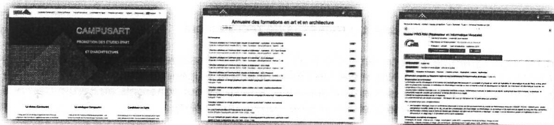
Le réseau CampusArt

Pour plus d'information : www.campusart.org